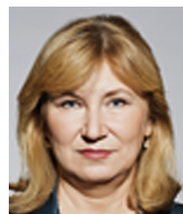
Eva Zamrazilová předsedkyně Národní rozpočtové rady

za poslední léta počet vládních úředníků roste a to i tam, kde to je zjevně zbytečné. Stejně tak nevím, proč stále existuje tolik různých vládních agentur a institucí, když vláda již 5 let mluví o jejich sloučení, případně i zrušení. Nedostali učitelé, relativně k obdobným profesím, již v posledních letech přidáno dost? A jak říkám, je to jen jeden z příkladů.