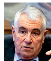
Kamil Janáček bývalý člen bankovní rady ČNB

Kromě štedrého rodičovského příspěvku je přitom pro státní rozpočet problém také to, že pozdější návrat na trh práce, který se v drtivé většině případů týká žen, má dlouhodobý negativní dopad na jejich pracovní kariéru. Jejich mzdy jsou nižší než mzdy jejich protějšků, odvádějí potom nižší příspěvky na zdravotní a sociální pojištění a nižší daně z příjmu fyzických osob. Nižší je pak i jejich celoživotní příjem a následný důchod, který potom řeší např. Komise pro spravedlivé důchody s jediným nápadem – zvýšit jim důchody, což má opět negativní dopad na státní rozpočet.