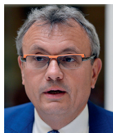
Vladimír Dlouhý prezident Hospodářské komory

Jsme krátce po skončení nouzového stavu a otázka navozuje, že by se mělo škrtat kvůli zhoršení deficitu veřejných financí v důsledku vládních opatření na zmírnění dopadů pandemie na českou ekonomiku. Kvůli koronaviru by se však škrtat nemělo. Mohli bychom se bavit o účelnosti a efektivitě jednotlivých krizových opatření, ale o nich již bylo rozhodnuto, tak nechť je vláda zrealizuje. Stát se rozhodnul pomoci, naše veřejné finance patřily před krizí k nejstabilnějším v Evropě a když se vláda rozhodla postižené podniky podpořit, tak by to mělo být nezávisle na velikosti i struktuře výdajové strany rozpočtu před krizí.