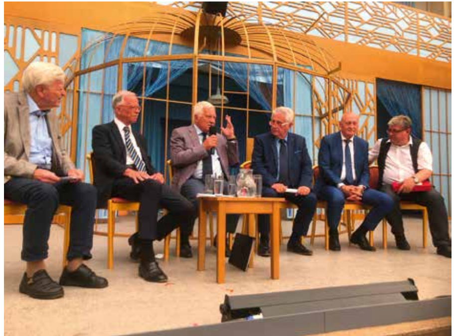
Václav Klaus v dolnorakouském městě Weitra, 5. srpna 2018.

Když jsem byl v roce 1969 při svém studiu v Americe požádán napsat o našem roce 1968 článek do tamního univerzitního časopisu, zmínil jsem v něm, že změny u nás začaly v okamžiku, kdy se po budovatelských písních a po sovětských častuškách začalo zpívat „Na okně seděla kočka“, kdy se zrodily první jazzové kluby, Fialkova