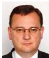
Petr Nečas bývalý premiér ČR

Význam všech výročí je pro dnešek zcela zásadní. Právě dnes musí česká politika rozhodnout zásadní otázku: Jestli jsme subjektem nebo objektem nadnárodního řízení? Naše hnutí je přesvědčeno, že pouze národní stát může být pevným garantem svobody a demokracie. Každá forma nadnárodního řízení bude naší svobodu a demokracii ohrožovat.