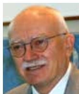
Karel Dyba bývalý ministr hospodářství