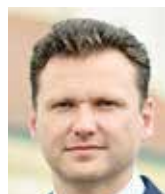
Radek Vondráček předseda Poslanecké sněmovny, hnutí ANO

Zůstaneme-li při výročí roku 1968 pouze u hysterického účelového falešného anti-rusismu, ukážeme, že o své moderní historii a jejich výročích vážně přemýšlet ani nechceme.