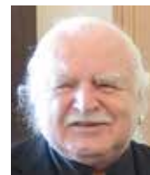
Milan Knížák výtvarník

na rok 1938 či 1948. Za druhé, roky 1938 a 1948 představovaly počátek zásadní systémové změny od demokratické 1. republiky a semidemokratické 3. republiky k totalitnímu režimu a ztrátě národní samostatnosti. Rok 1968 byl pouze soubojem o to, zda u nás bude hard nebo soft verze komunismu, ta v ideálním případě ústícím do československého kádárismu nebo titostismu jako dosažitelnému maximu. Nešlo zde také o národní samostatnost, vstup vojsk nebyl její ztrátou. Na rozdíl od východoněmeckých, maďarských a polských satrapů, kteří byli dosazeni a drženi u moci sovětskými tanky, byli českoslovenští satrapové považováni až do roku 1968 za spolehlivé. Skutečnou národní katastrofou nebyl 21. 8. 1968, ale 21. 8. 1969!