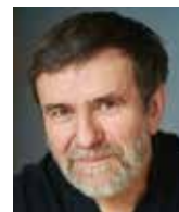
Vlastimil Vondruška historik

– postupně je ničena národní identita ve prospěch nějaké formy vlády EU, následně pak projektu NWO. Obojí znamená vládu nevolených elit, kulturní unifikaci a zánik reálného obsahu pojmu „demokracie“. Důkazem je fikce „evropský parlament“, jehož poslanci mohou vyjadřovat názory a zájmy dominantních států a nikým nevolené bruselské byrokracie, nikoli zájmy voličů. Účast v euro-volbách dokazuje, že jsou si toho občané dobře vědomi.