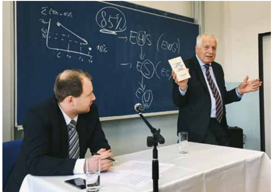
O vývoji integrace Evropy od původního EHS a ES k EU, o migraci ale i o práci prezidenta republiky přednášel a diskutoval v dubnu Václav Klaus se studenty Gymnázia Litvínov, 4. dubna 2018.

Po pádu komunismu jsme chtěli provést (a provedli) fundamentální systémovou změnu, nikoli jen dílčí reformy. Chtěli jsme tržní ekonomiku (jak já vždy dodával „bez adjektiv“), nechtěli jsme německé soziale Marktwirtschaft. Tržní ekonomika ve smyslu Misesa, Hayeka, Erharda nebo Euckena však v dnešní Evropě neexistuje. Chtěli