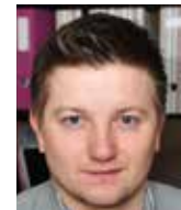
Aleš Rod Centrum ekonomických a tržních analýz

Je všeobecně sdílenou pravdou, že ve zdravotnictví je dostatek financí, jen dochází k jejich neefektivnímu využívání. Navýšit platbu za státní pojištění, která přinese dodatečné náklady rozpočtu ve výši 3,6 mld. Kč, bylo rovněž chybným vládním rozhodnutím. A takto bychom mohli pokračovat položku po položce. To bychom ale nesměli mít agrosocialistickou vládu a před sebou volby do Poslanecké sněmovny.