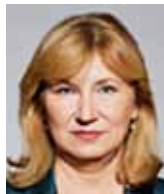
Eva Zamrazilová členka bankovní rady ČNB