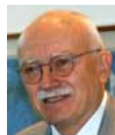
Karel Dyba bývalý ministr hospodářství

téměř výhradně ze zemí silně zasažených krizí. Zisk českých dcer proto může pomoci řešit existenční problémy matek. Lze jen volně uvažovat nad tím, jaké dlouhodobé důsledky tato politika českým firmám může přinést – žití z podstaty či nedostatek technologických inovací jistě není jejich vyčerpávající výčet. Tradiční argument, vysvětlující slabou investiční poptávku tím, že stávající kapacity nejsou plně využity, může zastírat i to, že kapacity vzniklé před krizí budou postupně zastarávat. Na kondici a sentimentu zahraniční ekonomiky tedy bude záviset nejen český export, ale i investiční a celkový rozvojový potenciál českého hospodářství.