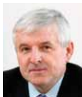
Jiří Rusnok premiér ČR

Úvahy, zda ještě je či už není recese, či zda jsme z ní už vystoupili, zdá se, rozdělují české analytiky. Definitivní čísla hovoří o meziročním poklesu HDP o 1,6 % a současně i o mezikvartálním růstu HDP o 0,6 %. Vidíme také, že stále ještě dochází k poklesu investic a stagnaci konečné spotřeby. Vývoj HDP tak „zachraňují“ jen velmi dobré výsledky zahraničního obchodu.