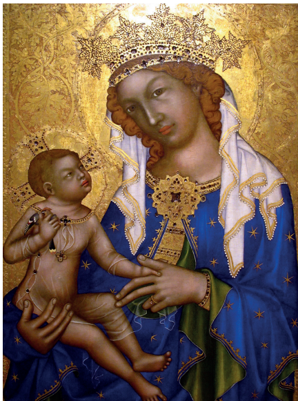
Madona Zbraslavská c. 1350–1360 Národní galerie v Praze, Anežský klášter

nostnější barvou, neboť její královsky modrý pigment se až do pozdního baroka získával z drahokamu lapis lazuli. Číslo dvanáct mělo krom hvězdné koruny Panny Marie v západním kontextu kulturních dějin vždy tuto symboliku: dvanáct apoštolů, dvanáct izraelských kmenů, dvanáct bran a dvanáct drahých kamenů Nebeského Jeruzaléma, dvanáct nejvýznamnějších andělů a dvanáct znamení zvířetníku. To jsou hlavní a historicky platné symbolické významy, které slouží jako pevné „precedenty“ v naší základní analýze.