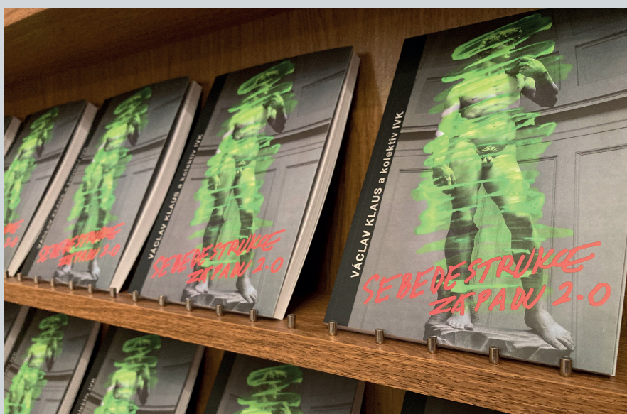
Sebedestrukce Západu 2.0 – Pád zrychluje