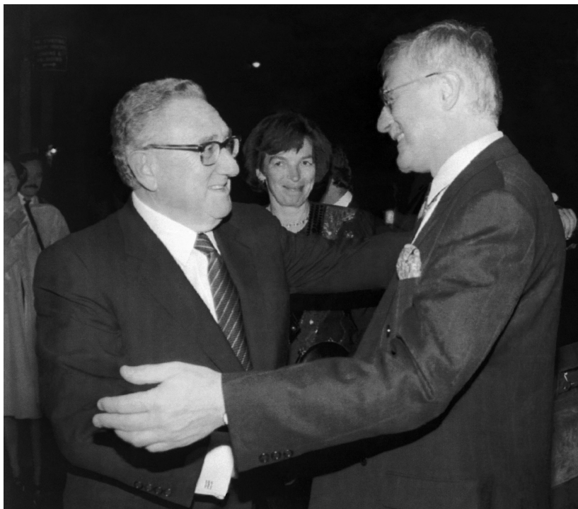
14. října 1993, New York, USA; foto: ČTK / AP

I přes železnou oponu jsme po srpnu 1968 vnímali Kissingerovu tzv. ping-pongovou diplomacii s Čínou, jím docílený, vskutku historický průlom v americko-čínských vztazích a ve změně konstelace tria USA-SSSR-Čína. Tento jeho velký čin změnil svět. Čin jeho a čin Nixona. Když jsem o tom jednou - v Praze, ve Strakově akademii v 90. letech - mluvil s ex-prezidentem Nixonem, roli Kissingera zdůraznil.