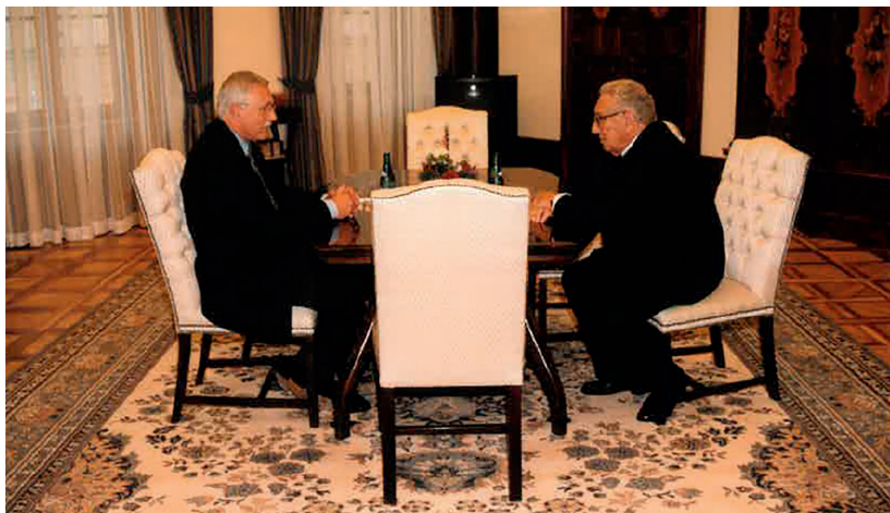
12. října 1998, Kancelář předsedy Poslanecké sněmovny Parlamentu ČR

Na jaře let 1991 a 1992 jsem jezdil na Helmutem Kohlem – nedaleko Bonnu, v hotelovém komplexu Petersberg, bývalém zámku tyčícím se nad Rýnem – organizovanou konferencí, na níž byl přítomen tehdy snad každý z kategorie who is who. Nejen politici nebo ex-politici němečtí a evropští, ale i američtí a dálnovýchodní. Byly to konference velmi otevřené, dnes bych řekl, že politicky nedostatečně korektní. Vzpomínám si na své ostré spory s norskou premiérkou Brundtlandovou o jí už tehdy prosazovaném konceptu tzv. udržitelného rozvoje (byla jednou z jeho raných autorek a propagátorek) a o nezbytnosti celoevropské armády.