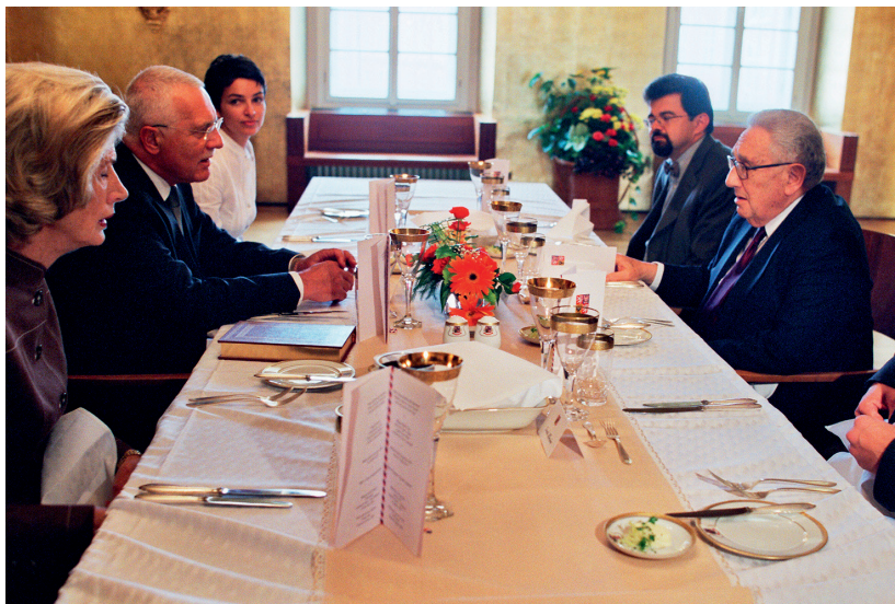
2. července 2003, oběd ve Zlaté jídelně na Pražském hradě, po pravici prezidenta Klause manželka H. Kissingera Nancy

„bombardování ještě nikdy nevyřešilo staletí trvajících problém“ a že se „proti historii nebojuje snadno“.