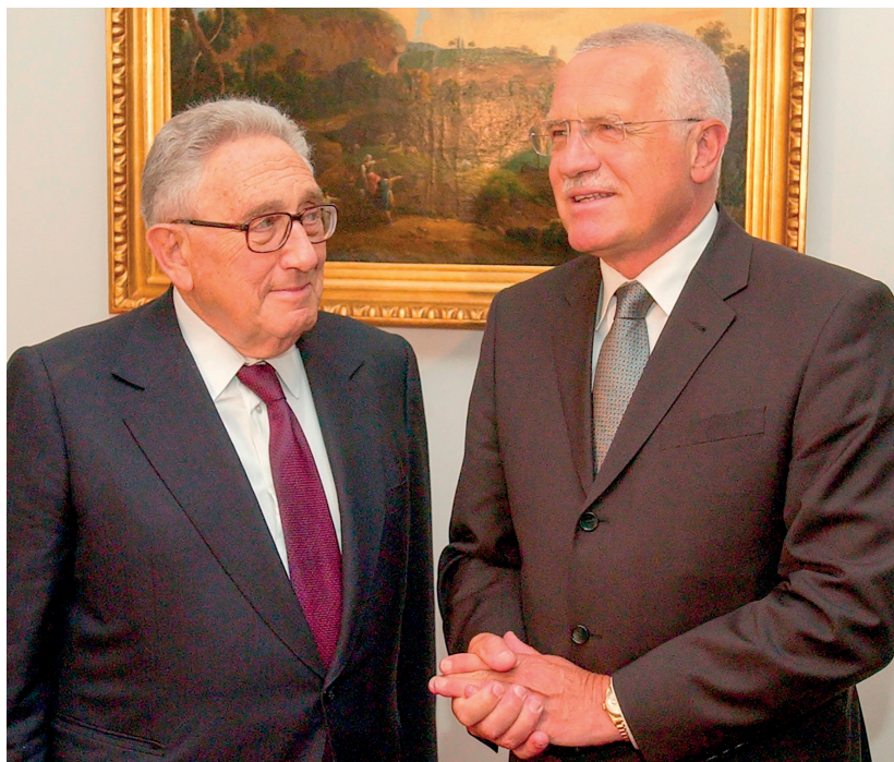
2. července 2003, Pražský hrad

Nevedu si bohužel žádný deníček svých různých setkání se světovými velikány, teď mi to trochu chybí. Napadá mne jeho návštěva Poslanecké sněmovny, když jsem tam tehdy předsedoval. Bylo to 12. října 1998. Je pikantní, že jsem tenkrát na tiskové konferenci řekl, že vypadá ve svých 75 letech velmi svěže. Co bych asi říkal teď, v jeho 100 letech! Blížily se tehdy nálety NATO na Jugoslávii kvůli Kosovu. Oba jsme se shodli, že