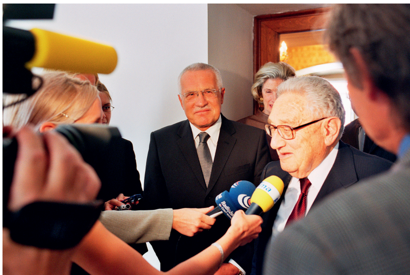
2. července 2003, Pražský hrad