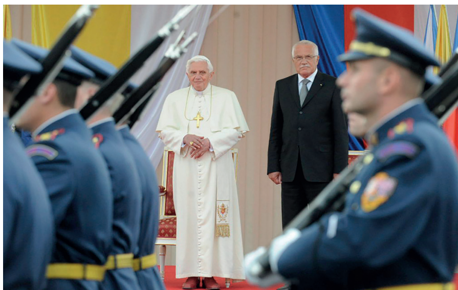
Některé hlavní milníky ve vzájemných vztazích mezi Václavem Klausem a papežem Benedik- tem XVI. naleznete v článku Jindřicha Forejta na stránkách www.institutvk.cz .