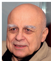
Ivan Mládek hudebník

cie, ale vysvětluje, že problém rasy nejen nezmišlel, ale stal se dominantní americkou obsesí.