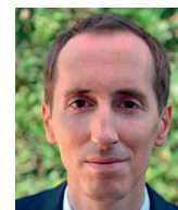
Jiří Brodský diplomat

Je v podstatě jedno, co čteme. Pokud se nechceme ze současného světa zbláznit, je nutné každý den v 19,00 nasadit digitální půst a jít v klidu číst, relaxovat a imaginovat. Přeji příjemné zážitky při čtení všem podporovatelům ale i ne-podporovatelům IVK.