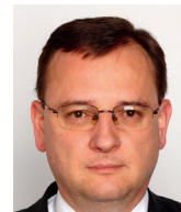
Petr Nečas bývalý premiér České republiky

žurnalistky, paní Oriany Fallaci Hněv a hrůza a Síla rozumu . Autorka píše jedinečným jazykem a reaguje na události, které nás přivedly k lesku a bídě současnosti. Jde o italskou Židovku, naturalizovanou v USA, žurnalistku, která byla členkou intelektuální elity, což v tomto povolání není vždy běžné. Píše pravdivě, často používá nevybíravý slovník, ale umožní nám hlouběji pochopit, co je to západní civilizace.