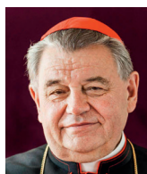
Dominik kardinál Duka emeritní arcibiskup pražský

Druhou knihou je dystopický román německé autorky Julie Zeh Ve jménu Metody (Argo, 2021). Popisuje společnost, která se upne na absolutizovaný cíl zdraví a likviduje jedince, kteří se tomu vzpírají. Německý originál byl napsán před třinácti lety, tedy před covidovskou hysterií, ale všechno tam bylo předpovězeno.