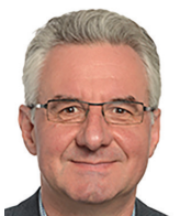
Jan Zahradil europoslanec ODS