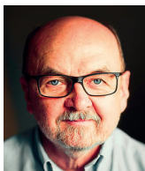
Ryszard Legutko europoslanec PiS

Paní předsedkyně, předsedové vlád! Dvě minuty pravdy, hořké pravdy. A ta pravda je taková, že Evropský parlament napáchal v Evropě mnoho škod.