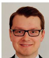
Filip Šebesta Institut Václava Klause

Všechny argumenty známe, rizika zneužití, jakési polehčující okolnosti zmiňující debaty o Češích v zahraničí. Neřekl bych nic nového. Ale jde tu o princip, a ne o menší, než o princip demokratický. Chceme moudré voliče, protože volba znamená zodpovědnost. Zodpovědnost bez námahy je ale čistou sublimací hry, v horším případě lhostejnosti. Myslím, že pověstné koblihy by v korespondenčním volebním nesystému zafungovaly jinak, než jak je jim dosud vyčítáno. (Mnohem intenzivněji.) Nevím, zda toto chceme.