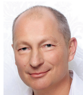
Petr Zimmermann bývalý hejtman Plzeňského kraje

Podobné výhrady mám i k elektronickému volebnímu hlasování. Osobní účast ve volební místnosti má prostě nejen svou tradici, ale je přirozenou obranou proti ohýbání většinové volební vůle.