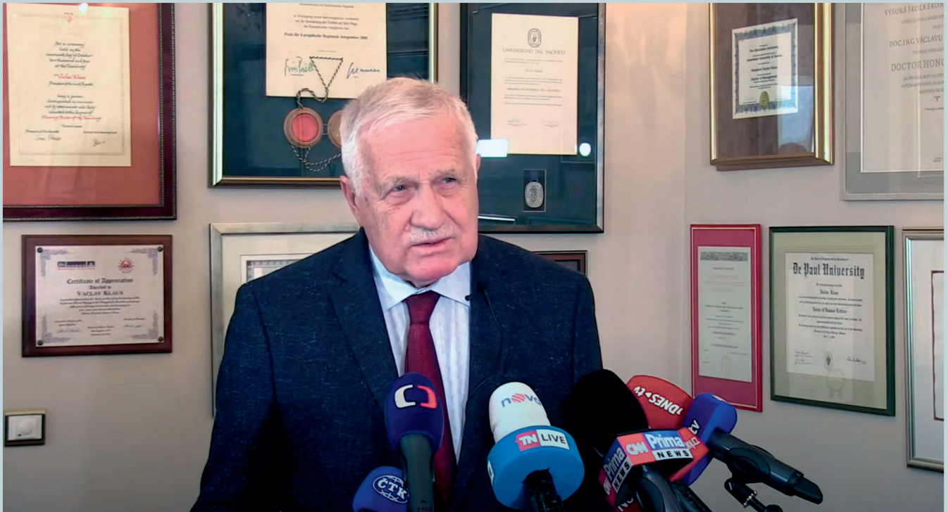
Tisková konference Václava Klause, 25. května 2021

V úterý 25. května 2021 jsme byli v ranních hodinách – a spolu s námi spousta myslících lidí – šokováni neuvěřitelnou snůškou lží, které jsme našli na třech stránkách Hospodářských novin a s nimi spřízněných médií. O jejich připravovaném útoku jsme věděli od počátku letošního května. Již 5. května jsme od nich dostali sérii otázek na téma půjčky Sovětskému svazu, která byla schválena vládou premiéra Adamce 10. listopadu 1989, tedy týden před 17. listopadem.