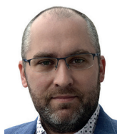
Ondřej Andrys náměstek ústředního školního inspektora ČR

Tedy ne pouze školství po lockdownu, mluvme především o školství před lockdownem. To, oč by tu mělo běžet, je zásadní (ale promyšlená a vydiskutovaná) reforma celého vzdělávacího systému v Čechách, ne post-lockdownové „opravy“.