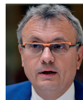
Vladimír Dlouhý prezident Hospodářské komory

rý ale přesto nelze hodnotit bezvýhradně pozitivně. Ze sociálního pohledu je samozřejmě zabránění masivnějšímu vzestupu nezaměstnanosti žádoucím efektem. Rovněž zaměstnavatelé, kteří by později s obnovením poptávky po své produkci byli nuceni hledat náhradu za dříve propuštěné pracovníky a složitě je zaškolovat, tento program jednoznačně uvítali. Antivirus ale na druhou stranu zbrzdil flexibilní přizpůsobování trhu práce – tomu by z dostupných dat nasvědčoval právě přetrvávající vysoký počet nabízených míst při rostoucím počtu uchazečů. Celkově se tedy během pandemie trh práce přiblížil rovnovážnému stavu z hlediska sblížení skutečné a přirozené míry nezaměstnanosti. Dlouhodobý strukturální (především kvalifikační) nesoulad nabídky a poptávky na trhu práce však pandemií patrně bohužel přechká.