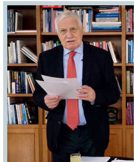
Výuka Václava Klause na NF VŠE. Václav Klaus každé úterý od 12.45 hodin přednáší v kurzu Transformační procesy v ČR. Přednášky jsou přenášeny online pomocí live streamu na Youtube kanále IVK. Díky laskavému svolení vedení fakulty je přenos a záznam dostupný i pro širší veřejnost.

Mělo by být dovysvětleno, že Camus nevidí – na rozdíl od mnoha jiných autorů a ve shodě se mnou – základní problém v islámu, ale v tom, že se do existujících evropských národů nepřijímají jen jednotlivci, ale celé národy. Nemá nic společného s extrémní pravicí, není ani žádným obdivovatelem strany Front national (Národní fronty). Svou vlastní stranu, s trochu zvláštním názvem Strana ne-škodnosti, založil do značné míry proto, že se „osobně nikdy nemohl žádným způsobem připojit“ ke straně, kterou původně představoval Jean-Marie Le Pen (str. 116), i když si je vědom toho, že tato strana od té doby prošla „očividně fázi proměny“ (str. 115).