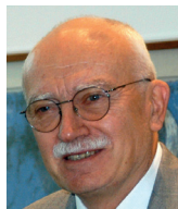
Karel Dyba bývalý ministr hospodářství ČR

Shrnu-li, pak o skutečném propadu růstu průmyslové výroby lze jen spekulovat, stejně jako o srovnání s jinými zeměmi. Platí však, že realita (i výhled?) je lepší, než jsme si vloni mysleli. Inflation odpovídá, ale o trhu práce nevíme skoro nic