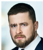
Aleš Michl člen bankovní rady ČNB

Patrně nejspolehlivější je v současnosti průmyslová statistika. Na rozdíl od jara 2020 průmyslové firmy (zatím?) produkují a vyvážejí. Data o zahraničním obchodě ukazují, že firmy nenaráží na zásadní omezení na straně nabídky, že jsou flexibilní a konkurenceschopné. I díky tomu jsou banky v dobré situaci. To může vytáhnout ekonomiku k růstu, oživil-li se světový obchod. Zatím se ale topíme v kovidové šlamastice.