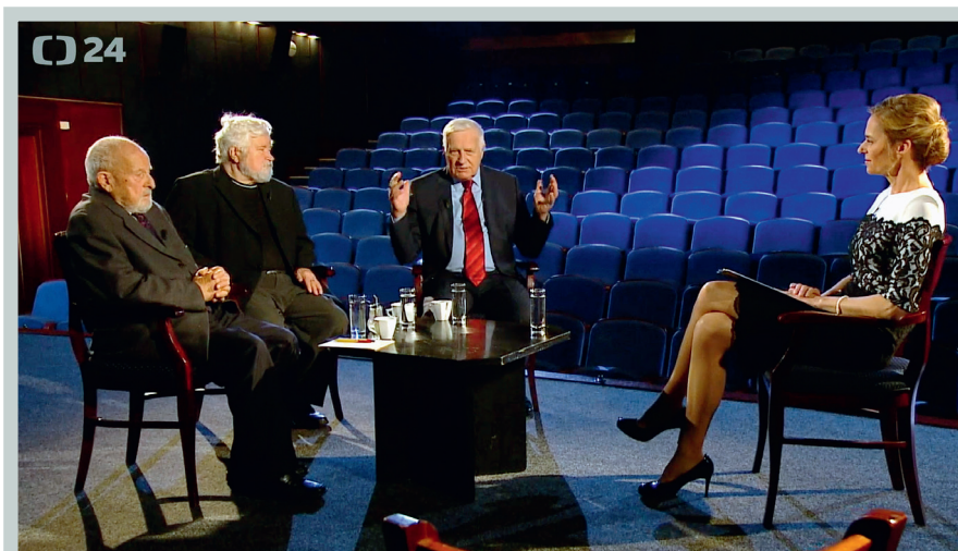
Václav Klaus se 17. listopadu 2019 zúčastnil diskuse České televize v prostorách bývalé Laterny Magiky, kde před 30 lety společně se Zdeňkem Jičínským a Petrem Pithartem formulovali základní programový manifest Občanského fóra „Co chceme“.

Publikováno v Mladé Frontě DNES, dne 9. listopadu 2019.