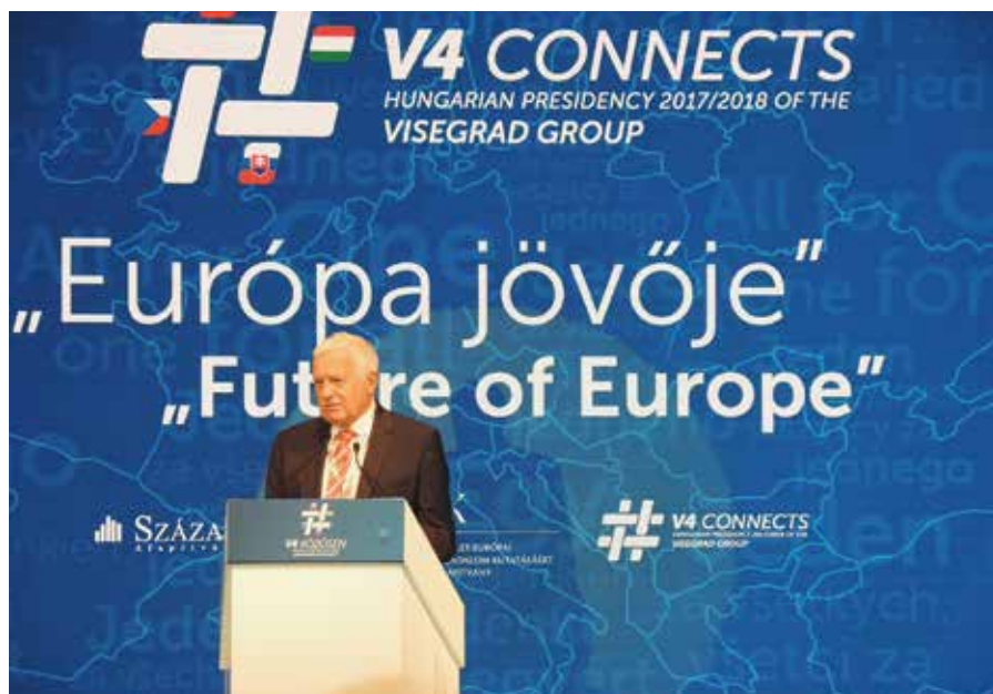
Václav Klaus na konferenci v Budapešti, 24. května 2018.

– USA jsou infikovány virem progresivismu (původně víceméně dovezeným z Evropy, ale dnes reexportovaným zpátky).