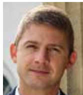
Petr Mach bývalý europoslanec

Trump má obecně v nelibosti vše mnohostranné, multilaterální. Přeregulovanost, případně „předotovanost“ jsou ale řešitelné právě v multilaterálním kontextu: společně definovat, co je regulace či dotace, nastavit pravidla a prosadit je u vlád i mezinárodních institucí. Víím, že právě tyto instituce často sklouznou k nadbytečné regulaci a začnou žít vlastním životem, nicméně dosud to vždy byla cena, která je vykoupena shora zvýšenými efekty volného obchodu.