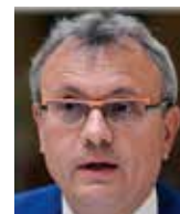
Vladimír Dlouhý prezident Hospodářské komory

Publikováno v MF Dnes dne 18. června 2018.