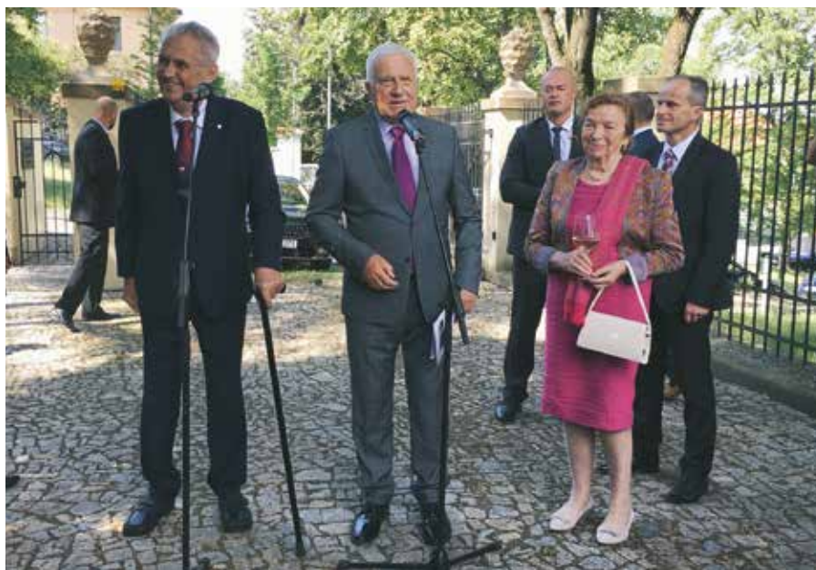
Poblahopřát Václavu Klausovi k jeho 77. narozeninám na pražskou Hanspaulku přišla i letos celá řada vzácných hostů, včetně prezidenta republiky Miloše Zemana. 18. června 2018.

Liberalizovaný, férový obchod, není možný bez mnohostranné, ideálně minimální regulace, vyžadující kompromis všech zúčastněných. Uplynulá nejméně tři desetiletí ukázala, že právě – přes všechny dílčí pře-