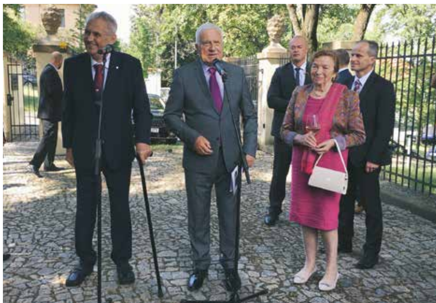
Poblahopřát Václavu Klausovi k jeho 77. narozeninám na pražskou Hanspaulku přišla i letos celá řada vzácných hostů, včetně prezidenta republiky Miloše Zemana. 18. června 2018.

Liberalizovaný, férový obchod, není možný bez mnohostranné, ideálně minimální regulace, vyžadující kompromis všech zúčastněných. Uplynulá nejméně tři desetiletí ukázala, že právě – přes všechny dílčí pře-