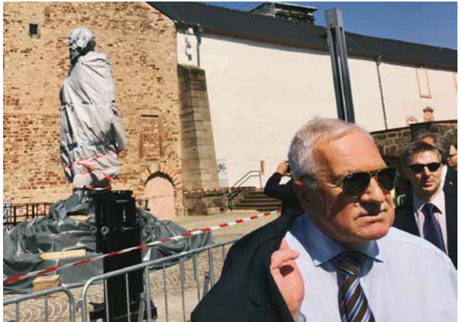
Václav Klaus v Trevíru, 4. dubna 2018. Zápisky z cesty Václava Klause – Za Marxem do jeho rodného Trevíru – najdete na www.institutvk.cz v sekci ostatní texty.

Je známá jeho aktivistická a intelektuální burcující teze, že myslitelé nesmějí svět pouze vykládat, ale že ho musí i měnit. To se mu skutečně podařilo. Komunistické diktatury dvacátého století od Marxe oddělit nelze, jakkoli by si to jeho dnešní stoupenci tolik přáli.