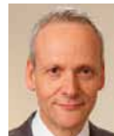
Cyril Svoboda bývalý ministr zahraničí

V dějinách jsme jednoznačně obstáli. Pořád tady jsme, máme svoji zem, řeč, víru, pořád zůstáváme národy. To vše pro nás uhájili naši předkové a totéž nyní musíme uhájit i my. Jde, jako už mnohokrát v naší historii, o samotnou naši existenci a já věřím, že uspějeme. Ostatně; nic jiného nám ani nezbyvá.