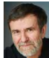
Vlastimil Vondruška spisovatel

Ve všech středoevropských jazycích se ne náhodně kultivoval Nietzscheho citát „Co nás nezabije, to nás posílí“. Věřím proto, že státy střední Evropy v prosazování svých zájmů obstojí a rýsující se středoevropská entita jim v tom pomůže. Jsem rád, že jsem se jako diplomat v Polsku a v Rakousku mohl na tomto pozitivním vývoji podílet.