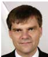
Rudolf Jindrák ředitel zahraničního odboru Kanceláře prezidenta republiky

Nám doporučuji jít do jádra Unie a svádět s dalšími zápas o její podobu. A tak na samostatnou roli Střední Evropy moc nesázím.