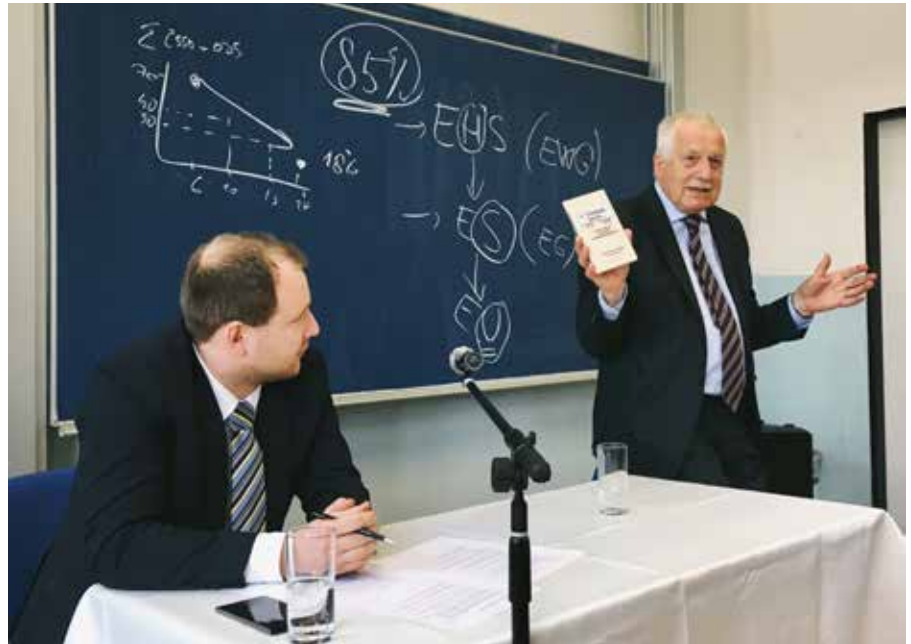
O vývoji integrace Evropy od původního EHS a ES k EU, o migraci ale i o práci prezidenta republiky přednášel a diskutoval v dubnu Václav Klaus se studenty Gymnázia Litvínov, 4. dubna 2018.

Po pádu komunismu jsme chtěli provést (a provedli) fundamentální systémovou změnu, nikoli jen dílčí reformy. Chtěli jsme tržní ekonomiku (jak já vždy dodával „bez adjektiv“), nechtěli jsme německé soziale Marktwirtschaft. Tržní ekonomika ve smyslu Misesa, Hayeka, Erharda nebo Euckena však v dnešní Evropě neexistuje. Chtěli