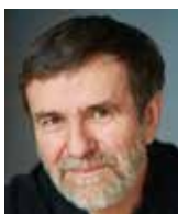
Vlastimil Vondruška spisovatel

v přímé demokracii, aniž by se zhodnotily zkušenosti a důsledky. Většina politiků chce zabránit ústavní změně umožňující, aby tak jako občané rozhodli o vstupu do EU, měli možnost rozhodovat v téže věci o odchodu z ní. Namítá se, že občané nejsou způsobilí to rozhodnout. Jde o tutéž záležitost dispozice s obsahem suverenity, o níž dříve hlasovali. Vstupem do EU se občané nestali méněcenní nebo hloupější, tím spíše, že jde o inkorporaci práva obsaženého v Lisabonské smlouvě. Ústava by se měla změnit v čl. 10a, že ČR může z důvodu bezpečnosti a ochrany národních zájmů převzít zpět tu část suverénních práv, které dříve předala mezinárodní organizaci nebo instituci.