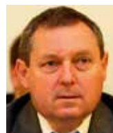
Jiří Maštálka poslanec Evropského parlamentu za KSČM

Tento či podobný postup jsou možné pouze za předpokladu, že to většina české politiky takto naléhavě cítí. Zatím to tak ale nevypadá. Rozhodná a důvěryhodná stanoviska prozatím slyšet nejsou. Naše politika se nechává zmítat chaosem a nedůvěrou a mlátí prázdnou slámu o své „prozápadnosti“. Pak to ale bude s námi mít Brusel ještě jednodušší, než by vůbec mohl doufat. A zdá se, jako by to rozhodujícím českým politickým formacím ani moc nevadilo.