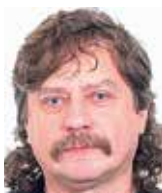
Jan Keller poslanec Evropského parlamentu za ČSSD

Voliči dali ve volbách jasně najevo, že tuto dnešní podobu české demokracie příliš neocenují. Přestaňme se proto strašit a hledejme cesty, jak náš politický systém učinit funkční a srozumitelný pro občany. Volby k tomu daly příležitost.