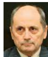
Ján Čarnogurský bývalý místopredseda vlády ČSR