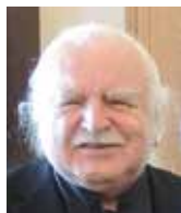
Milan Knížák výtvárník

Povolební vyjednávání v létě 1992 byly fěrovým řešením dlouholetých emancipačních snah Slováků. Je historickou zásluhou – ne vinou – Václava Klause a Vladimíra Mečiara, že vše dopadlo tak dobře.