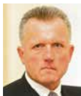
Miroslav Macek bývalý místopredseda ODS

Vývoj, rovnako ako čas, sa nedá zastaviť. Je mi ľúto, že z jedného väčšieho štátu sa stali dva menšie. Ponechal som si obe občianstva, tvorím pre obe republiky a stále sa cítim byť československým občanom, ako aj mnoho priateľov a kolegov mojej generácie.