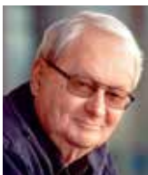
Ivan Kočárník bývalý ministr financí ČR

Já jsem jako student (21 let) Přírodovědecké fakulty strávil se spolužáky na fakultou organizovaném „geografickém výjezdu“ v létě 1991 týden na Slovensku. Ano, byli tam lidé (třeba vedoucí muzea), kteří vám řekli, že mají českou manželku a jsou pro federaci. Polovina lidí se k vám chovala neutrálně a slušně. Nicméně většina slovenských měst byla oblepená letáky otevřeně separatistickými, burcujícími. Každý den a zejména večer (chodili jsme jako mladí do města pochopitelně) jsme byli konfrontováni s otevřeně nepřátelskými projevy. Silný nacionalismus byl cítit všude. I od lidí slušných a vzdělaných, kteří často povídali neuvěřitelné teorie a názory. Jsem si jist, že od roku 1991 nebyla síla, která by mohla slovenskou emancipaci zastavit. Byla cítit přímo hmatatelně.