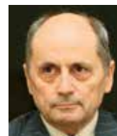
Ján Čarnogurský bývalý místopredseda vlády ČSR