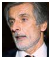
Peter Weiss velvyslanec Slovenské republiky v ČR

Češi tento slovenský postoj nechtěli chápat, nerozuměli mu a Československo emocionálně považovali za svůj stát. Ve skutečnosti však spojení se Slováků pro Čechy ztratilo smysl pro odsunu Němců. Ve svobodných poměrech po roce 1989 česko-slovenské antagonismy eskalovaly živěny nechápavou a necitlivou politikou tehdejšího prezidenta Havla a většiny české politické reprezentace. Osamělé snahy Václava Klause zachovat fiskální transfery na Slovensko, bez nichž společný stát nemohl existovat, situaci změnit nemohly. Do voleb v roce 1992 byla federace díky tlaku slovenských nacionalistů a neobrátlosti a neschopnosti jejich partnerů na české straně tak rozložena, že vítězové voleb již společný stát zachránit nemohli. Naštěstí na české straně byl tímto vítězem Václav Klaus, který se předchozích národnostních tahanic neúčastnil a na Slovensku neztratil kredit, a tak mohl s Vladimírem Mečiarom dosáhnout rozumné, vstřícné a vyvážené dohody o rozdělení Československa.