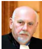
Pavel Rychetský předseda Ústavního soudu ČR

preferujú. Ak by sa takáto otázka hypoteticky aj položila – za predpokladu, že by sa na jej formulovaní zhodli zvolené politické reprezentácie, odpovede na ňu by neprišli s pravdepodobnosťou hraničiacou s istotou nadpolovičnú zhodu v oboch republikách o želanej podobe spoločného štátu. ČSFR sa rozdelila, lebo významné časti českej a slovenskej spoločnosti mali až diametrálne odlišné prístupy k spôsobu riešenia otázky nového štátoprávneho usporiadania.