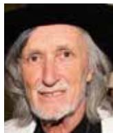
Juraj Jakubisko režisér

Roli Václava Klause si zvykla česká společnost podceňovat, ale až zvětřejí povrchní havlovské nátěry, uvědomíme si, že politiky jasně a reálně Klausovy postoje znamenaly pro probouzející se Českou republiku něco podstatného.