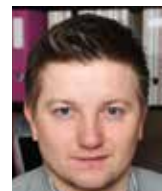
Aleš Rod Centrum ekonomických a tržních analýz

Je všeobecně sdílenou pravdou, že ve zdravotnictví je dostatek financí, jen dochází k jejich neefektivnímu využívání. Navýšit platbu za státní pojištění, která přinese dodatečné náklady rozpočtu ve výši 3,6 mld. Kč, bylo rovněž chybným vládním rozhodnutím. A takto bychom mohli pokračovat položku po položce. To bychom ale nesměli mít agrosocialistickou vládu a před sebou volby do Poslanecké sněmovny.