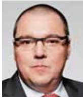
Miroslav Singer guvernér ČNB

Záporné úrokové sazby sice někteří naši kolegové využívají, určitá skepse vůči tomuto nástroji je však na místě. Moje zdrženlivost k jejich využití jako nástroje efektivního uvolnění měnových podmínek je odrazem několika faktorů: limitu rozsahu použitelnosti, pochyb o efektivnosti tohoto nástroje a rizik jejich delšího používání.