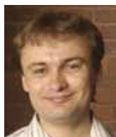
Luboš Motl fyzik

Prodělal obyčejný člověk, který nepatří do žádné z těchto tří skupin. Ten to bude všechno platit. Kvůli tomu dělají tyto tři skupiny celý ten pařížský týjatr, aby to pro ty, kteří o tom moc přemýšlet nechtějí, vypadalo maximálně věrohodně. Naším úkolem je motivovat je k tomu, aby přemýšlet začali.