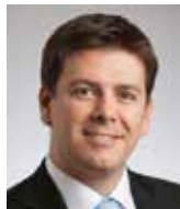
Jan Skopeczek Institut Václava Klause

ČNB se před dvěma roky přidala k měnovým válkám a nyní nemá na výběr: chce-li dosáhnout vyšší inflace, musí oplácet stejnou kartou ostatním centrálním bankám. Pokud nedojde k revizi cílů měnové politiky, konec intervencí brzy neuvidíme.