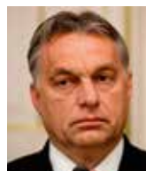
Viktor Orbán maďarský premiér

váženost a obrana našich zájmů. Víím, že je to těžší a komplikovanější než se nepozorován skrýt v měkké, teplé a chlupaté náruči nějakého pohostinného tvora, ale je to jistě důstojnější našich tisíc a jedno sto let starých dějin v Karpatské kotlině.