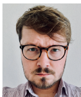
Filip Šebesta Institut Václava Klause

Některé věci je potřeba asi neustále opakovat. Tak tedy. Proč že si pravice typicky myslí, že zvyšování daní není dobrý nápad?